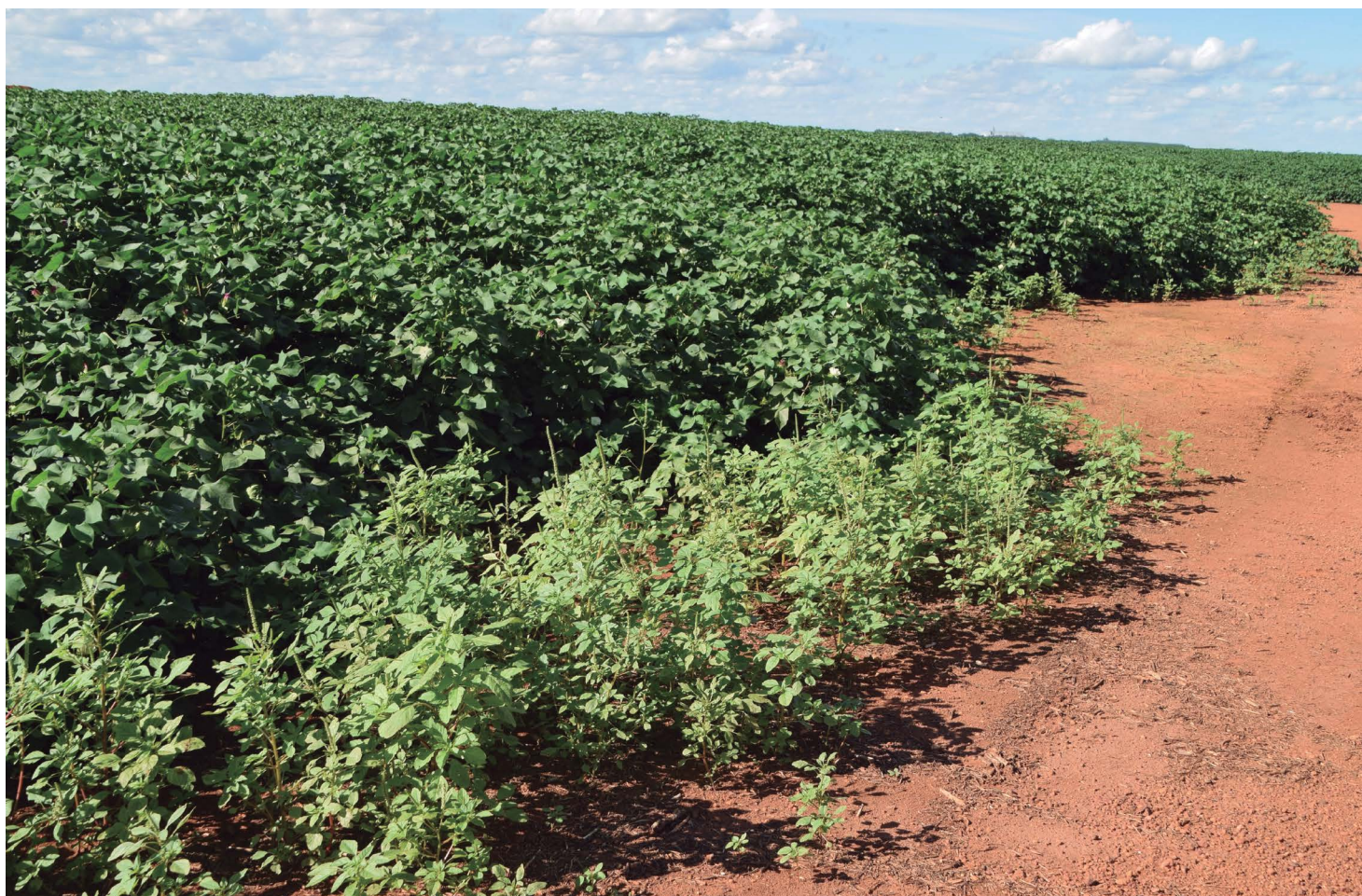
Amaranthus palmeri em bordadura.