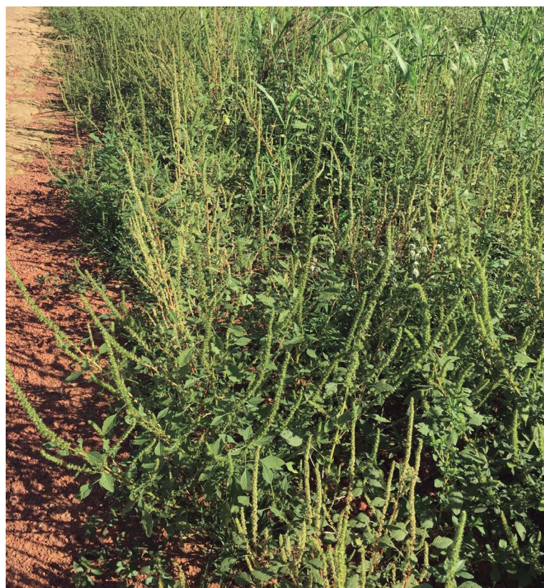
Amaranthus palmeri em bordadura/áreas não cultivadas.