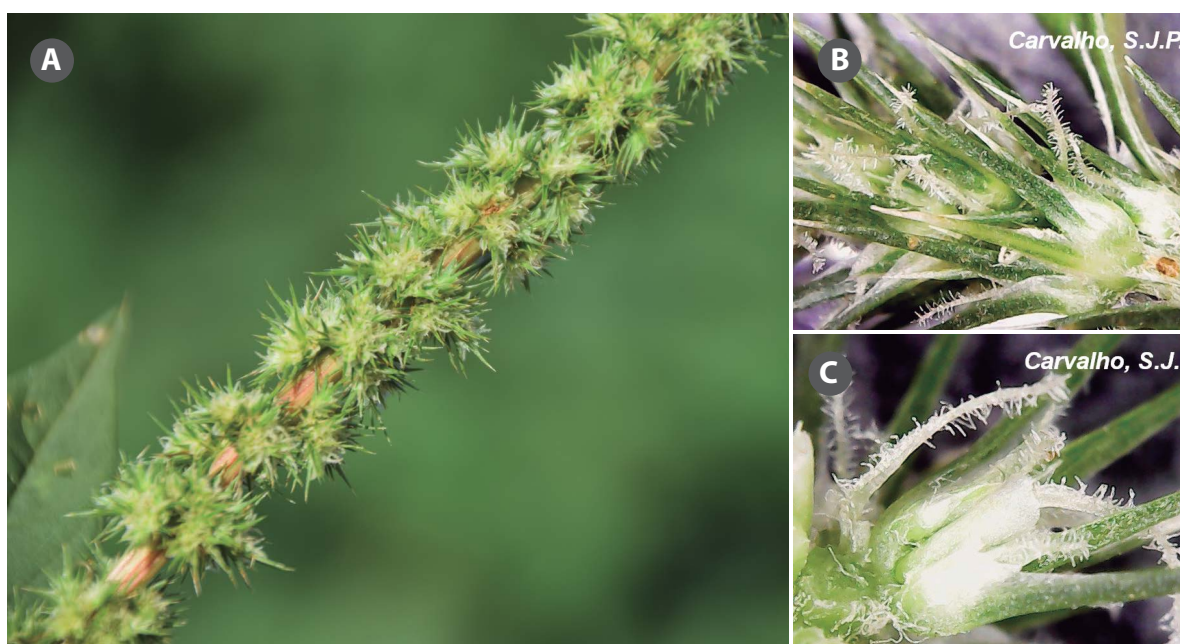
Figura 1. Detalhe das flores e inflorescências femininas de A. palmeri .