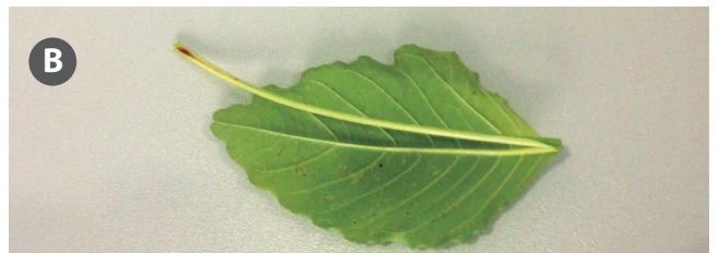
Figura 3. Folha de Amaranthus palmeri , com pecíolo mais longo que o limbo.