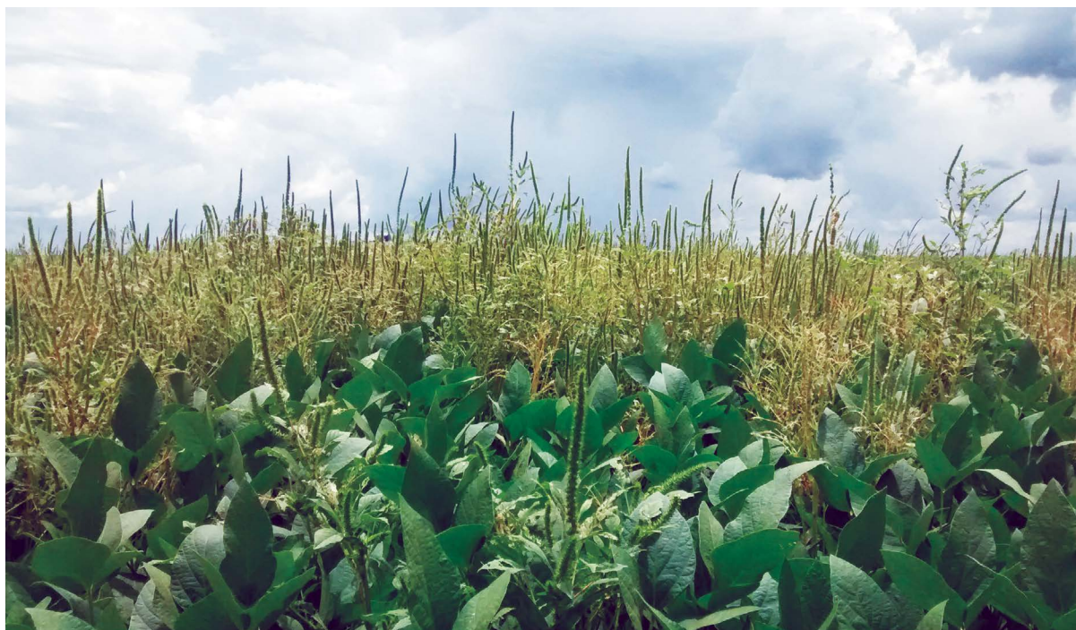
Amaranthus palmeri em lavoura de soja.