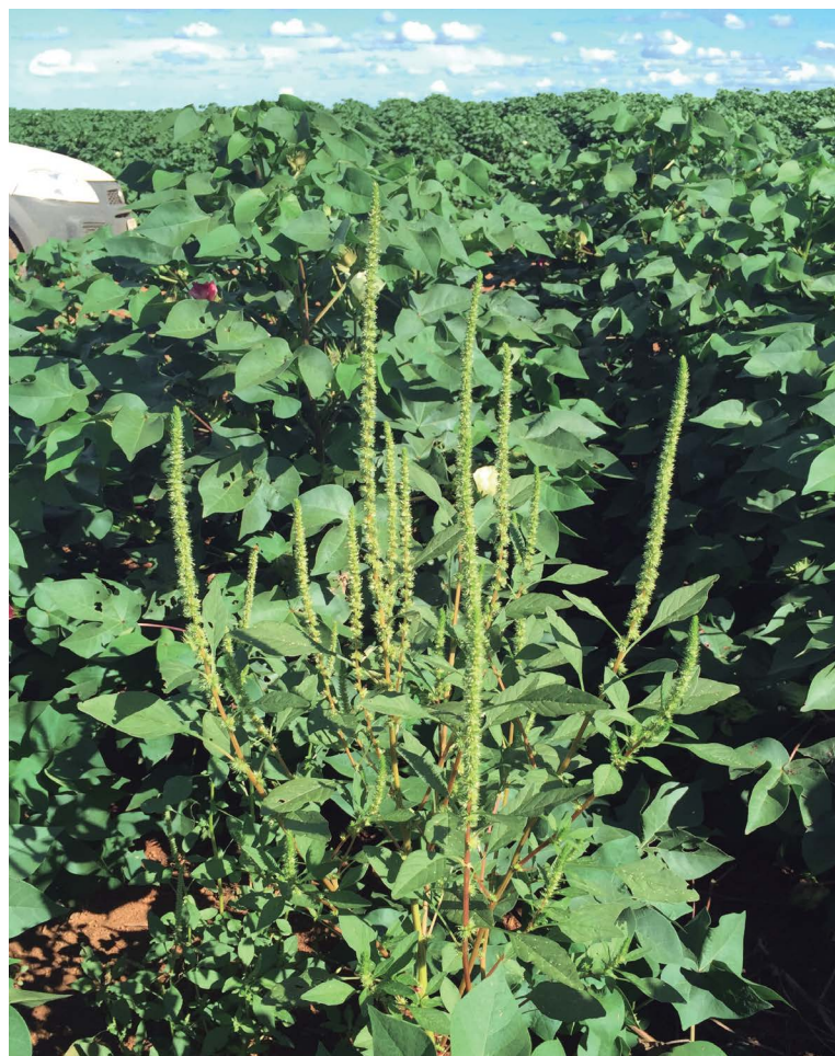
Amaranthus palmeri em lavoura de algodão.

Nos Estados Unidos, há populações com biótipos de A. palmeri que apresentam resistência simples a herbicidas de cinco mecanismos de ação: inibidores da ALS, inibidores da EPSPs, inibidores da HPPD, inibidores da tubulina e inibidores do fotossistema II. O