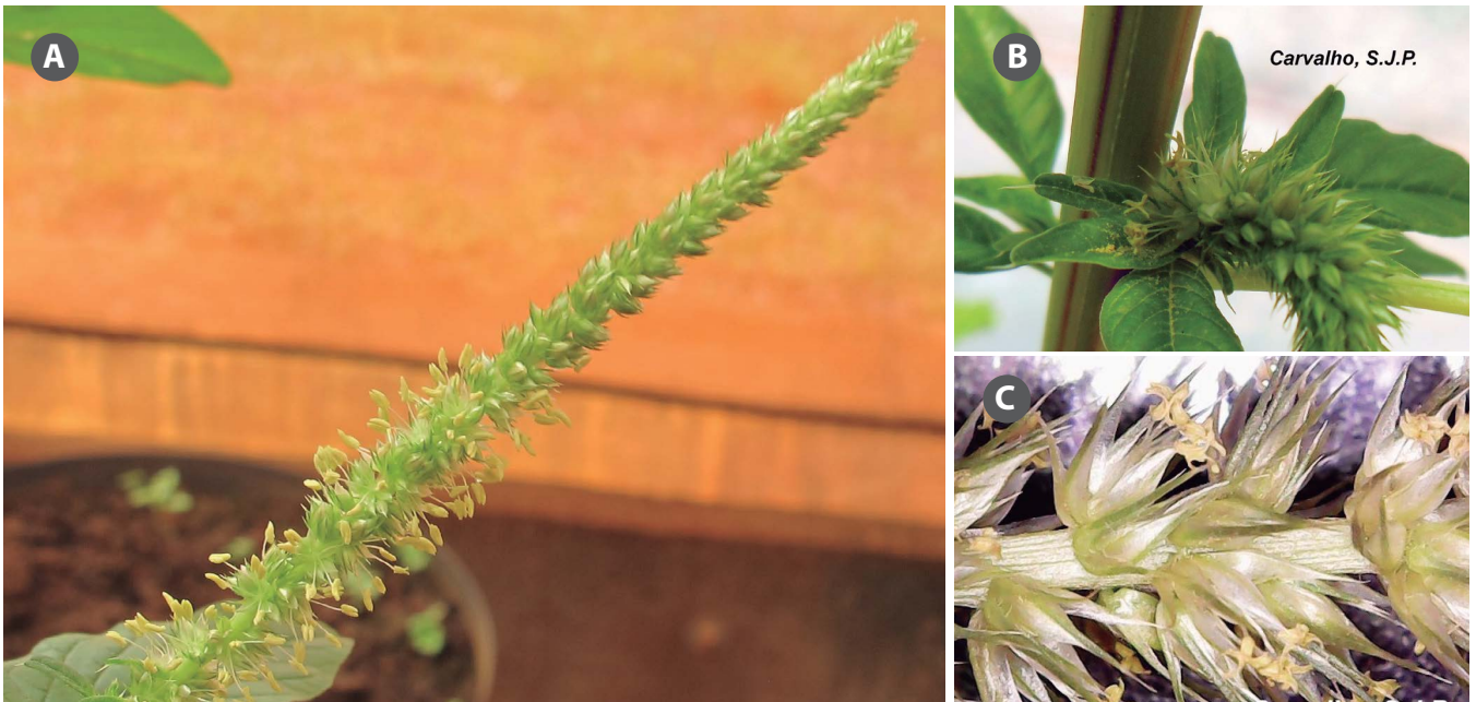
Figura 2. Detalhe das flores e inflorescências masculinas de A. palmeri , com destaque para as anteras expostas e bem visíveis.