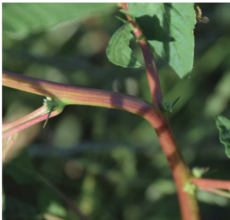
Figura 4. Espinho em Amaranthus spinosus , na axila de uma folha.