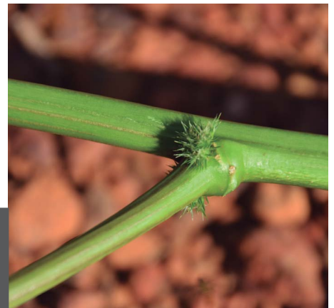
Figura 5. Estrutura espinescente que pode ocorrer em Amaranthus palmeri .