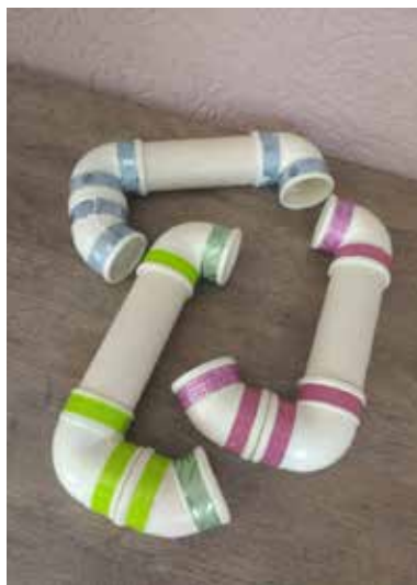
Fotografia 1: Imagem de alguns sussurrofones criados pelas bolsistas

Trata-se de uma ferramenta importante para se trabalhar com crianças em fase de alfabetização, com dificuldades nas relações cinema e grafemas, e que falam muito baixo. Esse trabalho foi idealizado depois de observações de duas salas de 3º ano, onde foi possível verificar que alguns alunos ainda possuíam problemas no processo de alfabetização. Diante disso, buscou-se meios de intervenção, até que surgiu a ideia de usar os sussurrofones.