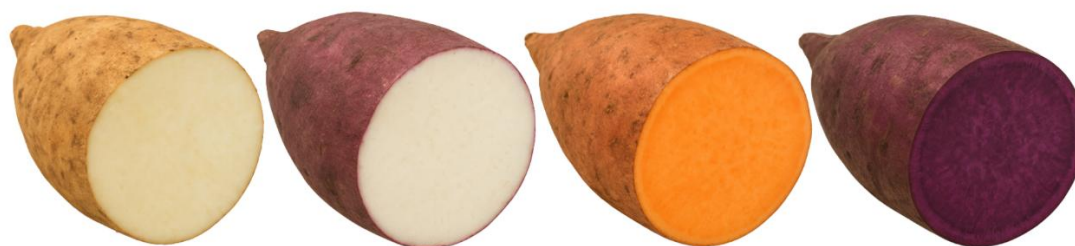
Figura 1. Batata-doce de polpa branca e casca branca (PBCB), polpa branca e casca roxa (PBCR), polpa alaranjada e casca alaranjada (PLCL) e polpa roxa e casca roxa (PRCR), respectivamente.

Foram utilizadas quatro amostras de batata-doce cozida, diferenciadas pela cor da polpa e da casca: polpa branca e casca branca (PBCB), polpa branca e casca roxa (PBCR), polpa alaranjada e casca alaranjada (PLCL) e polpa roxa e casca roxa (PRCR).