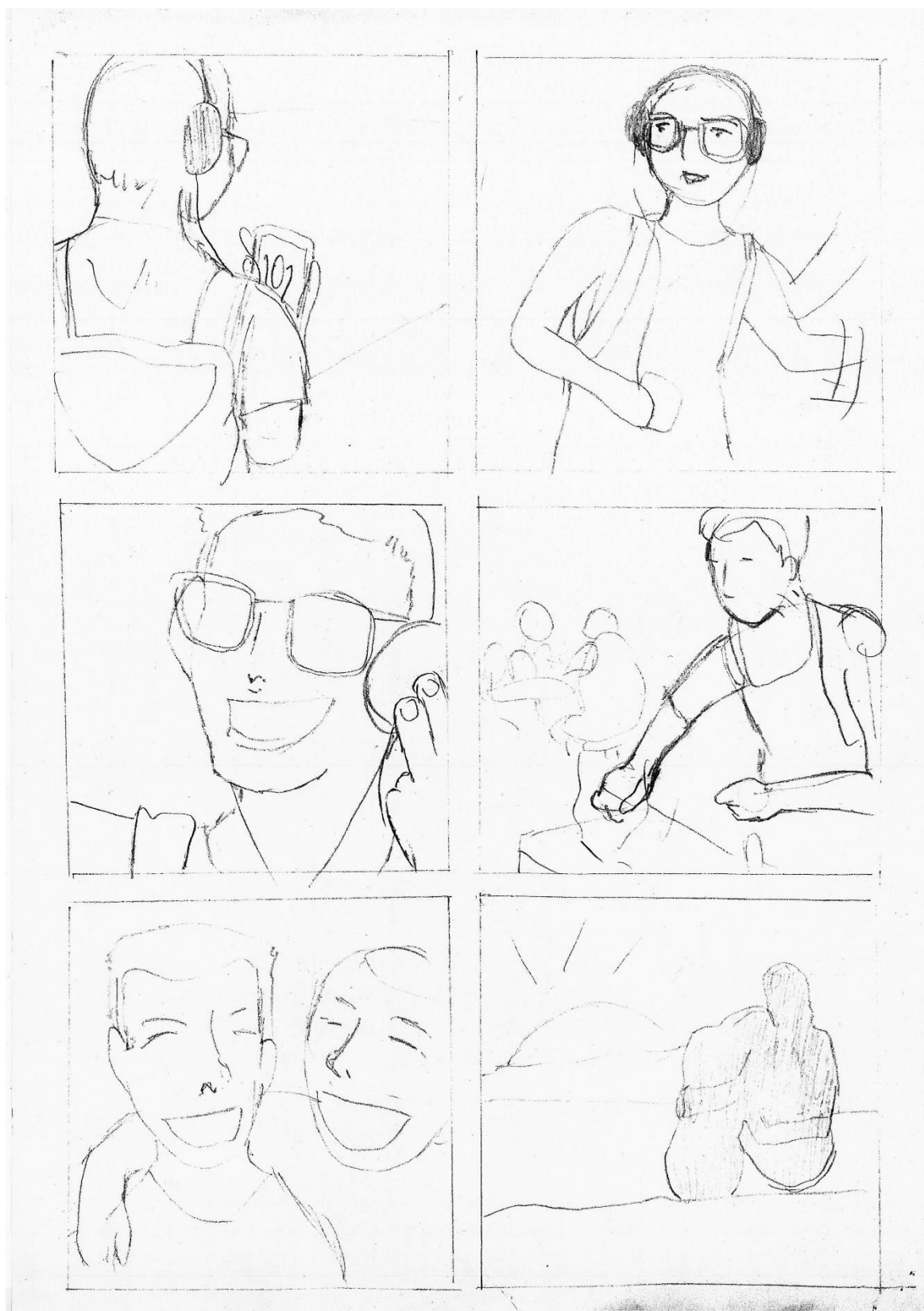
Figura 3 - Story board C