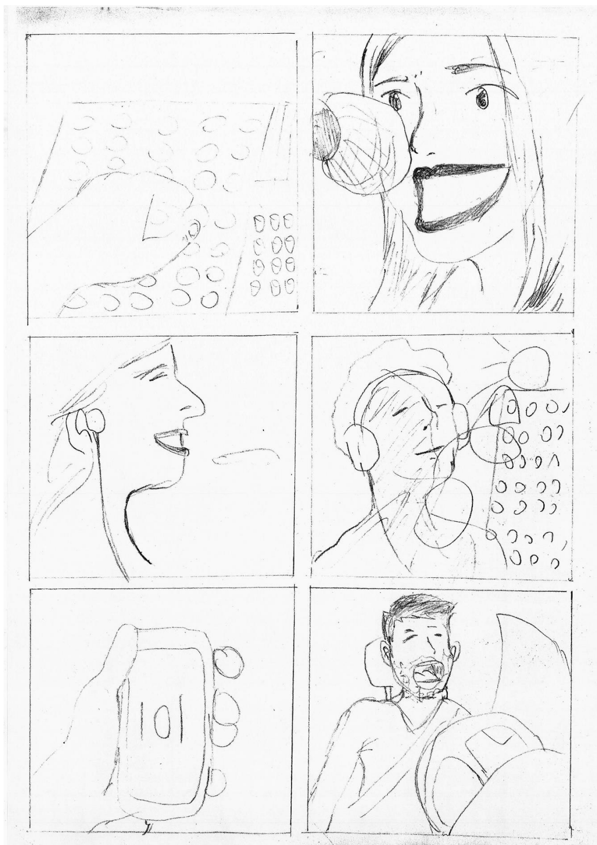
Figura 6 - Story board F