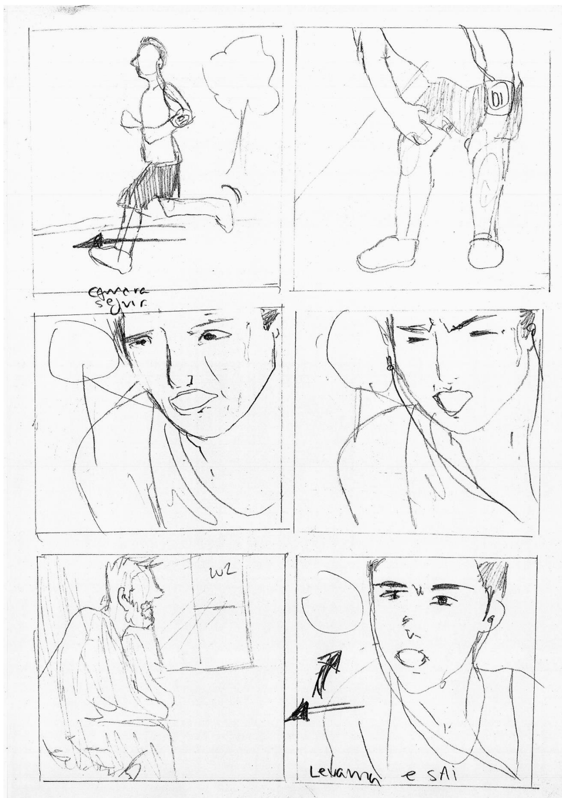
Figura 4 - Story board D