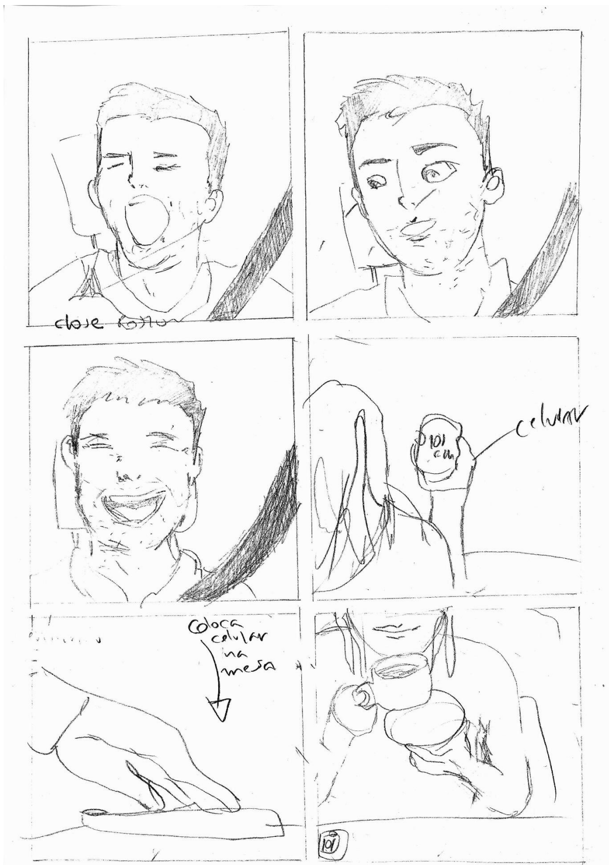
Figura 2 - Story board B