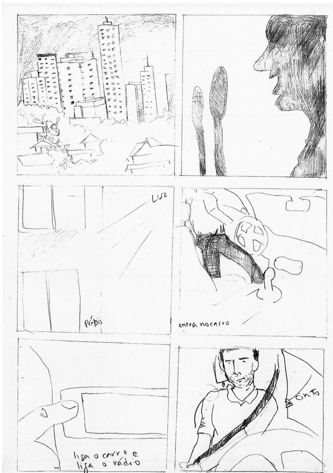
Figura 1 - Story board A