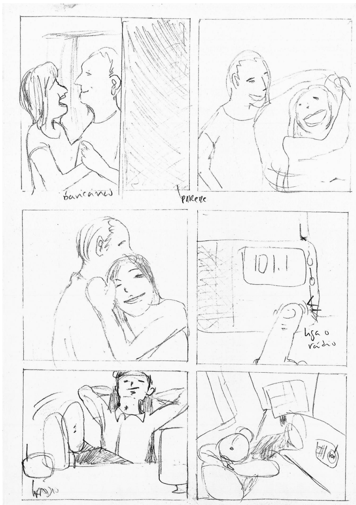
Figura 5 - Story board E